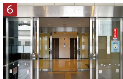
正面エレベーターより4Fへお進みください。