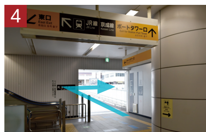
当センターサインを目標に歩行者専用デッキをお進みください。