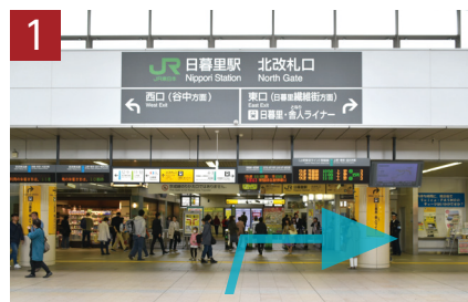
北改札口を出て右へ、東口方面にお進みください。

〒116-0013 東京都荒川区西日暮里2-22-1 ステーションプラザタワー401 TEL.03-3873-9272