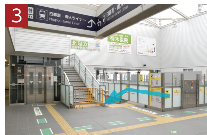
舎人ライナー改札手前の階段よりポートタワー口にお進みください。