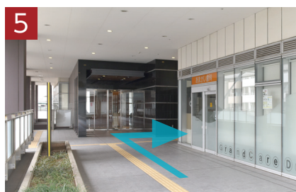
あまがい歯科の先を右へ、ステーションプラザタワーへお入りください。