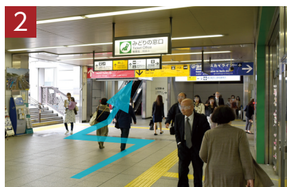
舎人ライナー日暮里駅方面へ、エスカレーターをお上がりください。